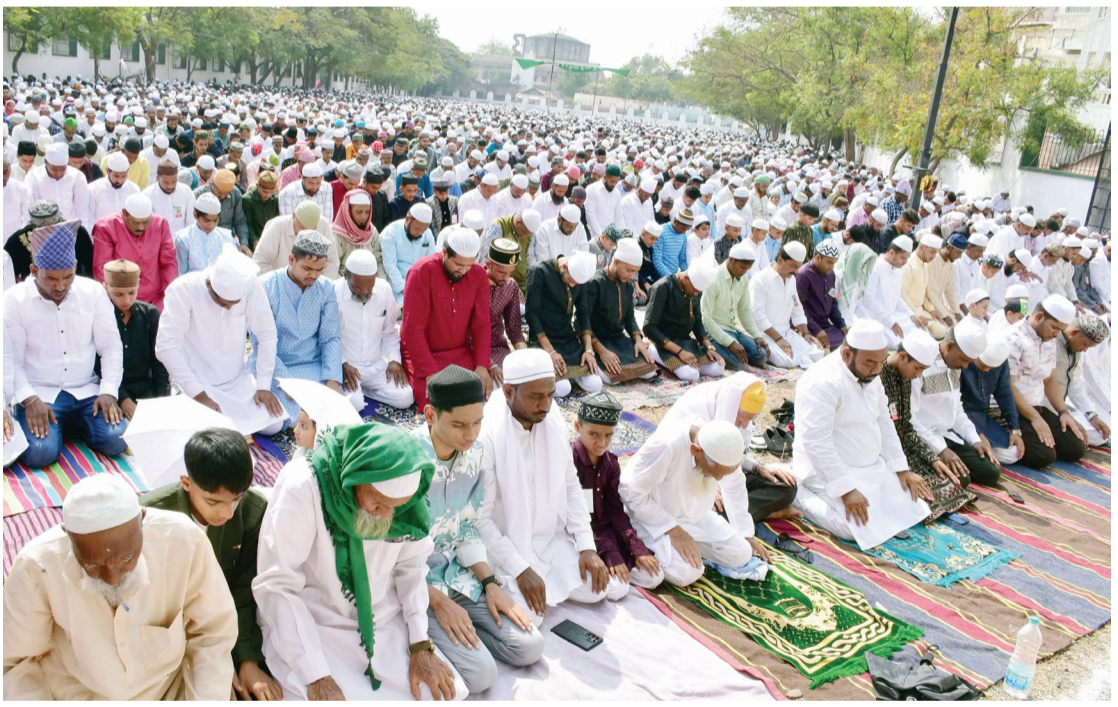
नगर शहरात आज रमजान ईद उत्साहात साजरी करण्यात आली. रमजान ईदनिमित्त कोठला येथील ईदगाह मैदानावर मुस्लिम समाजबांधवांनी सामुहीक नमाज पठण केले.

संस्थांवर टाकण्यात आली आहे. नगर शहराला मुळा धरणातून वार्षिक साठा ३९.०७ दशलक्ष मी मंजूर आहे. त्यातून वीस टक्के पाणी कपात करण्यात आल्याने ३१.२६ दशलक्ष पाणी वापरता येणार आहे. आतापर्यंत मनपाने १०.८ दशलक्ष पाणी वापरले आहे. आता पुढील चार महिन्यांसाठी अवघे १३.४६ दशलक्ष पाणी शिल्लक आहे. त्यामुळे या पाण्याचे नियोजन मनपा प्रशासनाला करावे लागणार आहे. हे नियोजन करतांना मनपा प्रशासनाला तारेवरची कसरत करावी लागणार आहे. दरम्यान मनपा प्रशासनात पाण्याचे योग्य नियोजन न केल्यास शहरातील नागरिकांवर पाण्यासाठी वगण फिरण्याची वेळ येण्याची शक्यता आहे.