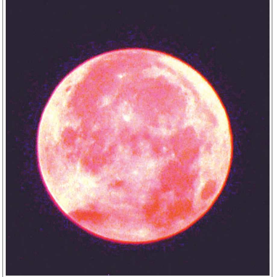
आज (बधुवार) पहाटेच्या सुमारास आकाशात गुलाबी चंद्राचे दर्शन घडले. नयनरम्य पिंग मून किंवा सुपर मूनचे अनेकजण साक्षीदार बनले. (सविस्तर वृत्त पान ३ वर)