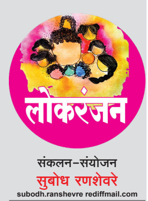
संकलन-संयोजन सुबोध रणशेखरे

यांनी सांभाळली आहे. संगीत सौरभ भालेराव तर नृत्यदिग्दर्शन सुभाष नकाशे यांचे आहे.