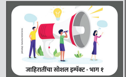
जाहिरातींचा सोशल इम्पॅक्ट - भाग १

'टाटा टी'ज - 'जागो रे' : टाटा चहाच्या 'जागो रे' जाहिरातींनी चहाचा ब्रॅंड आणि सामाजिक बदलासाठी